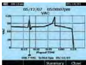
Graphique des données enregistrées