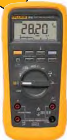
Fluke 28 II