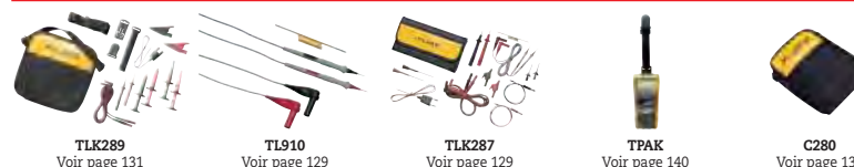
TLK289 Voir page 131