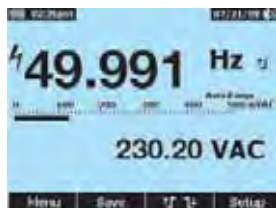
Précision et performances