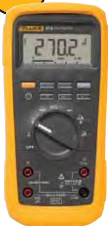
Fluke 27 II