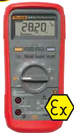
Fluke 28 II Ex

Pour le 28 II Ex, voir aussi pages 121 et 122.