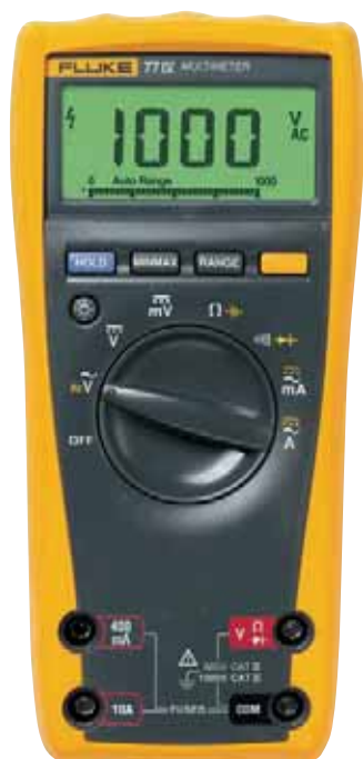
Fluke 77 IV

par rapport à la Série 70 de Fluke et offre désormais davantage de fonctions de mesure, un écran plus large facilitant la visualisation et une conformité aux normes les plus récentes en matière de sécurité.