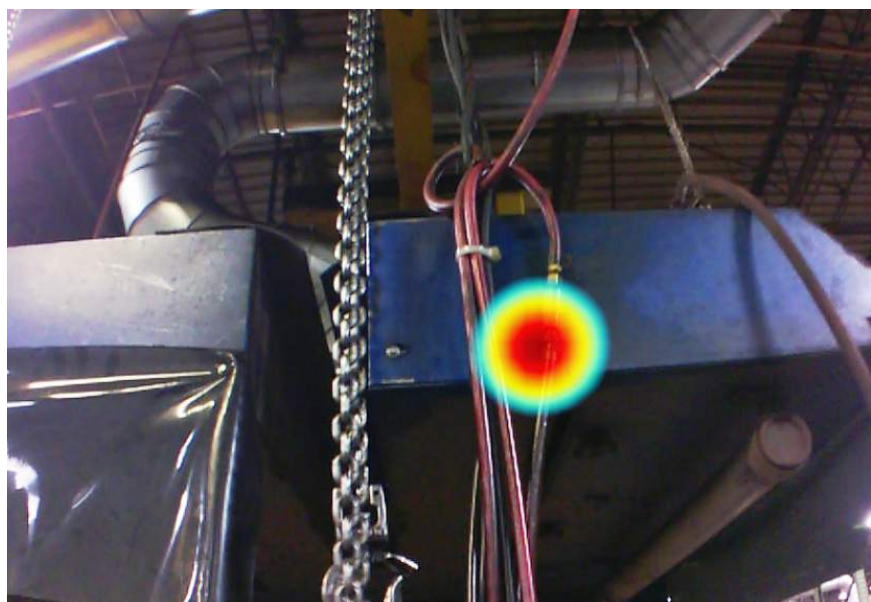
Images prises avec la caméra acoustique ultrasonore Fluke ii900 dans un environnement industriel.